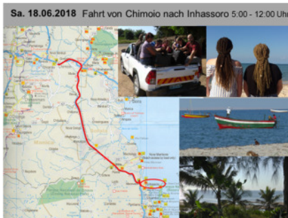
Ende der Reise