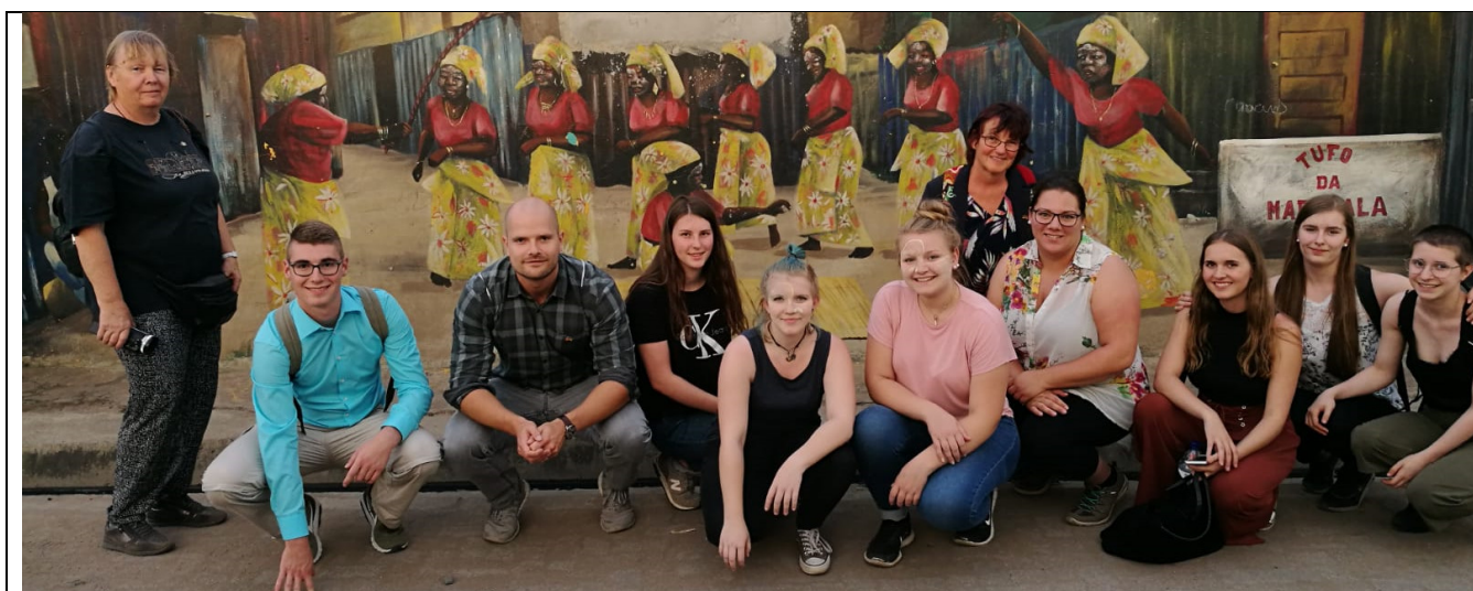
Und in Mafalala vor einer bemalten Hauswand

Unser Aufenthalt in der Region Chimoio umfasste 8 volle Tage, die wie immer voll gespickt mit Programmpunkten waren!