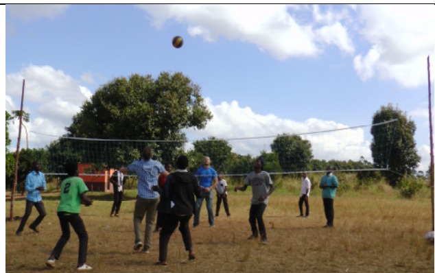
und ein gemeinsames Volleyballspiel an der Uli-Seibert-Schule veranstaltet