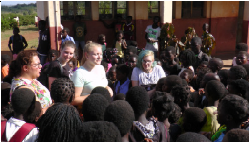
Besuch in Nhamacoa Rica

Neben unseren Besuchen an den Partnerschulen EPC Nhamacoa Rica, EPC Chibuto II, der oben beschriebenen Einweihung der ES Josina Machel und natürlich unserer innigsten Partnerschule (jetzt Sekundarschule) ES Uli-Seibert waren wir auch wieder an der EPC Mucessua eingeladen, wo wir mit lebenden Tauben beschenkt wurden.