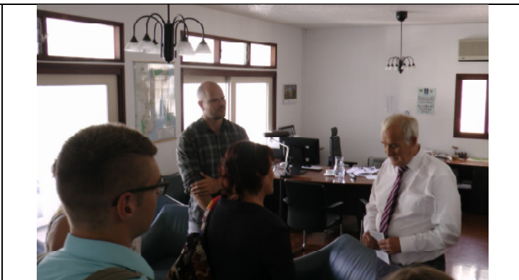
Im Gespräch mit dem Botschafter