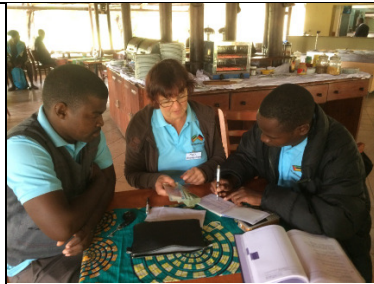
Spende der THS Baunatal für Chibuto II