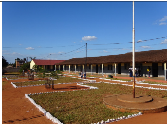
Renovierter Altbau, Schulgelände Juni 2018