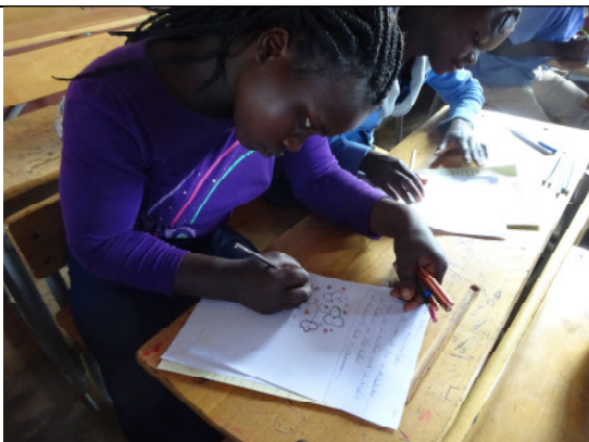
Briefe aus Hungen werden beantwortet