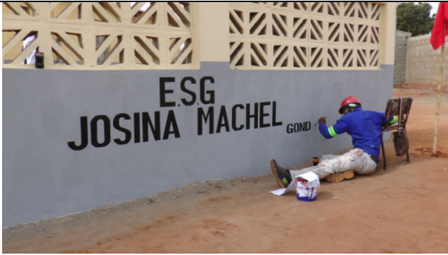
Letzte Vorbereitungen vor der Einweihungsfeier