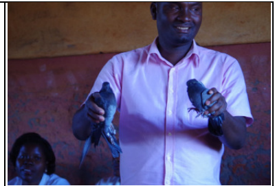
Tauben für die Freundschaft in Mucessua