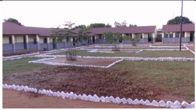
Blick auf das Schulgelände – der Schulhof wurde von Eltern, den Schülern und Lehrern gemeinsam angelegt.