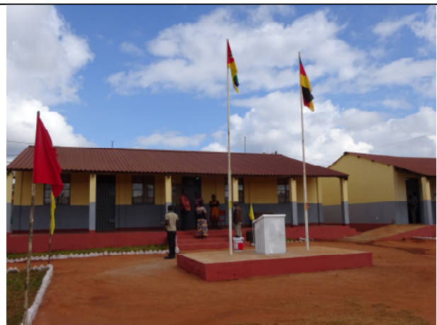
Verwaltungsgebäude 22. Juni 2018