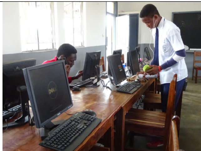
Die 30 Computerarbeitsplätze werden eingerichtet