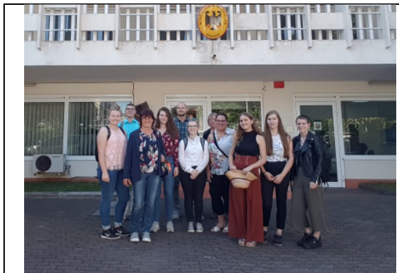
Die Reisegruppe vor dem Eingang zur Botschaft