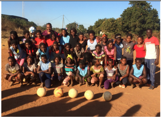
Der Verein hat auch ein starkes Mädchenteam, das täglich trainiert.